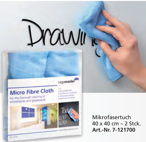
Mikrofaser Tuch 40 x 40 cm – 2 Stck. Art.-Nr. 7-121700